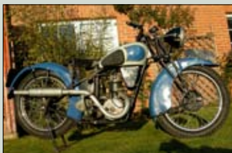
S.O.S. r.v. 1938, 350 cm 2 vodou chlazený soutěžní model, jeden z devíti kusů, sběratelský unikát k renova- ci. Funkční stroj. cena: 117.000,- Kč