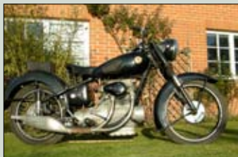
Sunbeam S8 500 cm provozoschopný motocykl cena: 109.000,- Kč