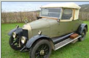
Morris Cowley, (Bullnose Morris) r. v. 1925 plně funkční udržovaný stav. cena: 431.000,- Kč