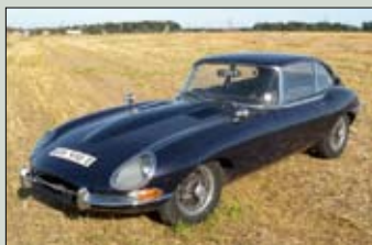
Jaguar E type 4,2 litru, serie I., r.v. 1964, plně funkční originál cena: 489.000,- Kč