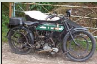
B.S.A. 4 1/2 , r.v. 1918 (možná 1917), 570 cm 2 , se sidecarem №2, plně funkční stroj, zdokumentovaný původ. cena: 389.000,- Kč