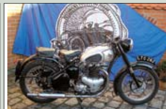
B.S.A. Star Twin r.v. 1951, 500 cm 2 , 2-válec velmi pěkná, nemusí se s ní nic dělat. cena: 150.500,- Kč