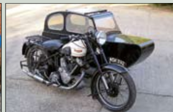
Panther 100 se sidecarem, r.v. 1950, 600 cm 2 , sidecar Watsonian, dvoumístný. originál k Pantheru, velmi zachovalá dvo- jice, cena: 207.000,- Kč