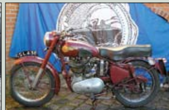
Royal Enfield Bullet r.v. 1955, 500 cm 2 , britský model plně funkční cena: 101.000,- Kč