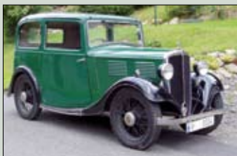
Standard Nine, r.v. 1934, 1052 cm 2 , čtyřválec, plně funkč- ní, registrovaný v ČR, zúčastnil se mnoha soutěží, závodů do vrchu a výstav cena: 185.000,- Kč