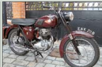
B.S.A. B 40 r.v. 1961, 350 cm 2 velmi pěkná, najeto 2518 mil cena: 89.000,- Kč